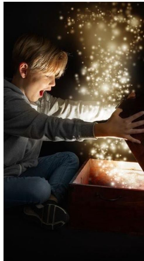
PENSAMOS ALÉM DA CAIXA