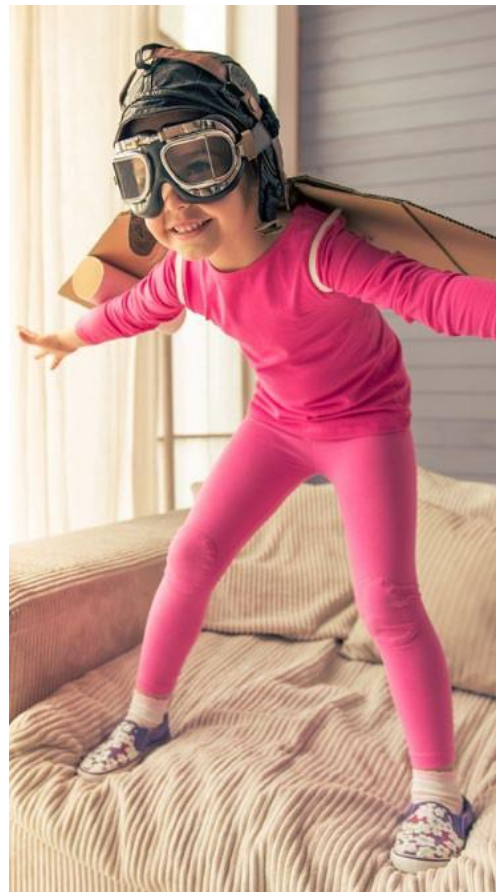
ACREDITAMOS NO PAPEL DA CORAGEM