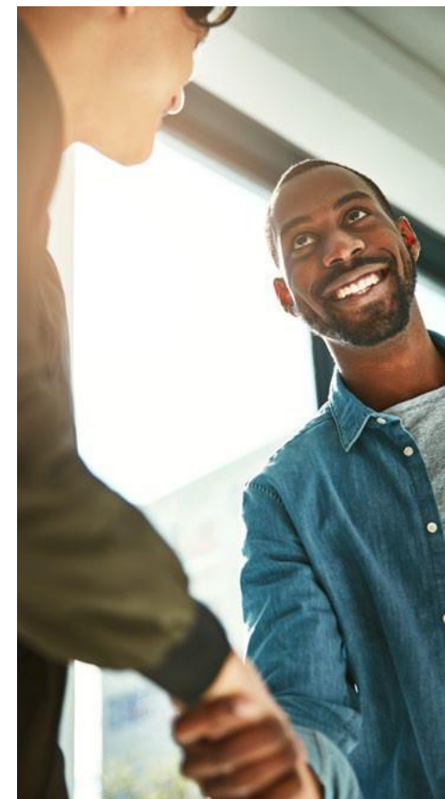
FAZEMOS COM TATO